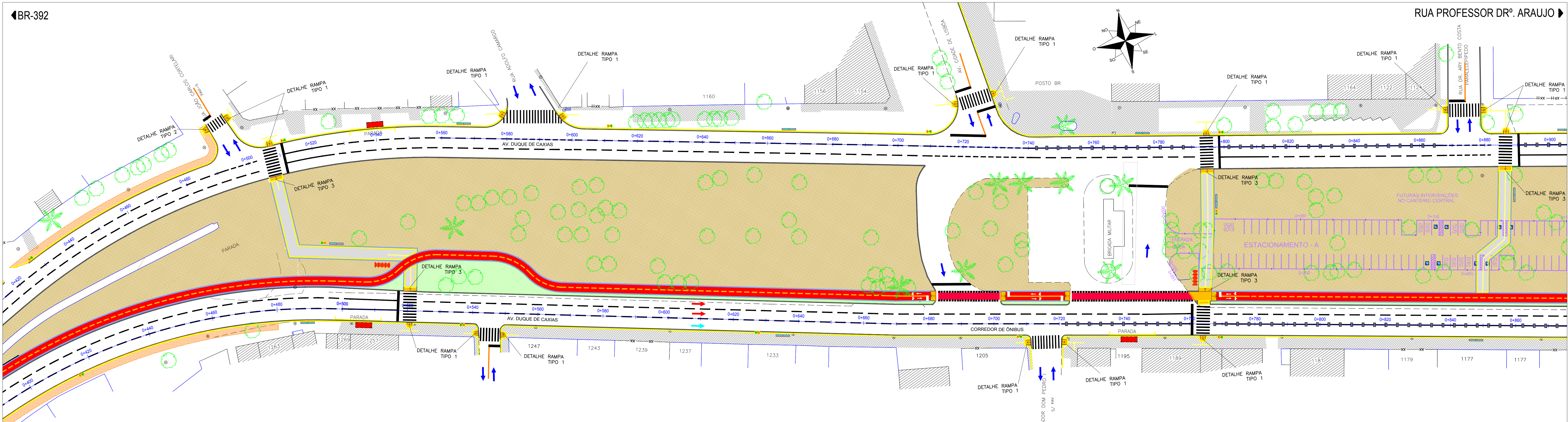
PLANTA BAIXA ESCALA = 1/500